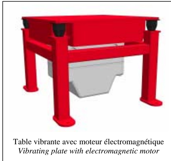
Table vibrante avec moteur électromagnétique Vibrating plate with electromagnetic motor