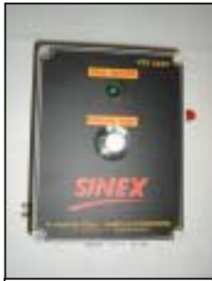
Coffret VTS 2-10 EAFC VTS 2-10 EAFC Box