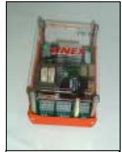
Platine VTS 2-10 EAFC VTS 2-10 EAFC Plate